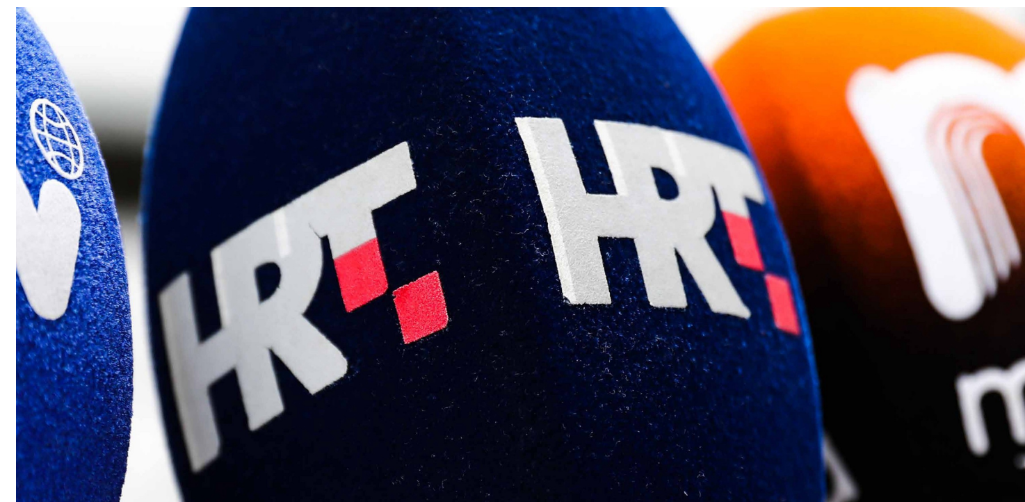
Croatian Radio and Television public broadcaster (HRT)

HRT, javna radiotelevizija, djeluje financijski neovisno kroz pristojbu i komercijalno oglašavanje. Međutim, misija MFRR-a utvrdila je da je ta neovisnost potkopana stagniranjem financiranja i nedavnim sporazumima koji HRT vežu uz dodatak prihoda iz državnog proračuna, uvodeći potencijalno još izraženiji utjecaj Vlade na program. Zakonski propisana neovisnost o političkim pritiscima ugrožena je saborskim postupkom imenovanja vodstva i nadzornih tijela HRT-a, koja ovisi o jednostavnoj većini glasova, što omogućava političko uplitanje.